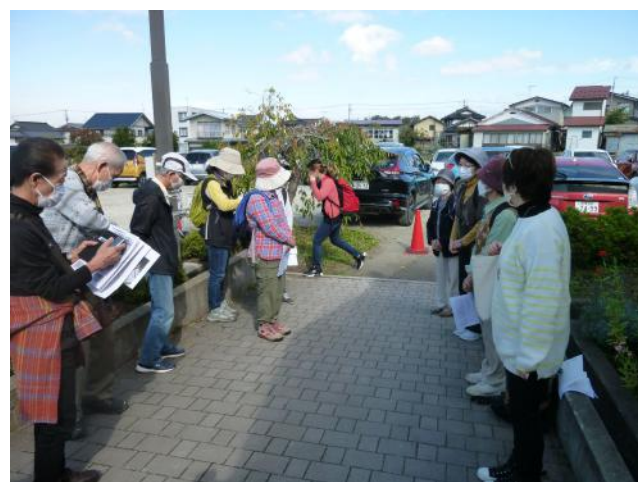
・参加者16名 自己紹介