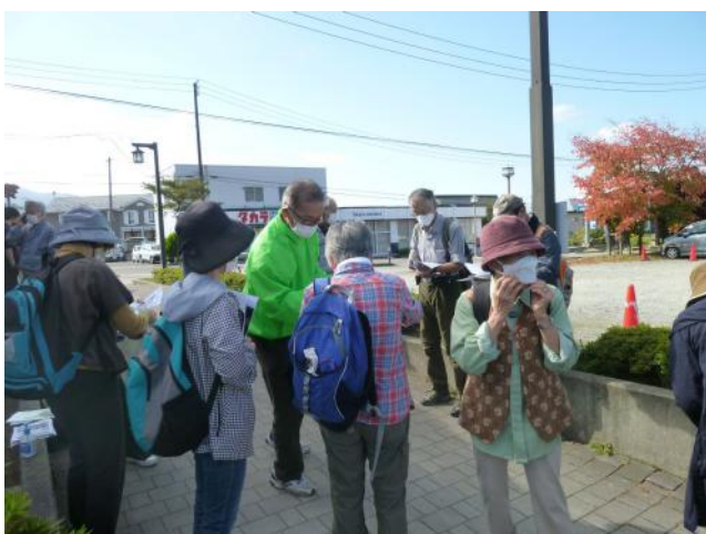
・新型コロナウイルス感染防止対策:体調確認・体温測定