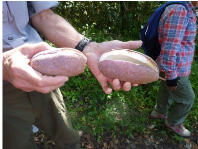
・熊谷泰人さん、7kg + を見つける